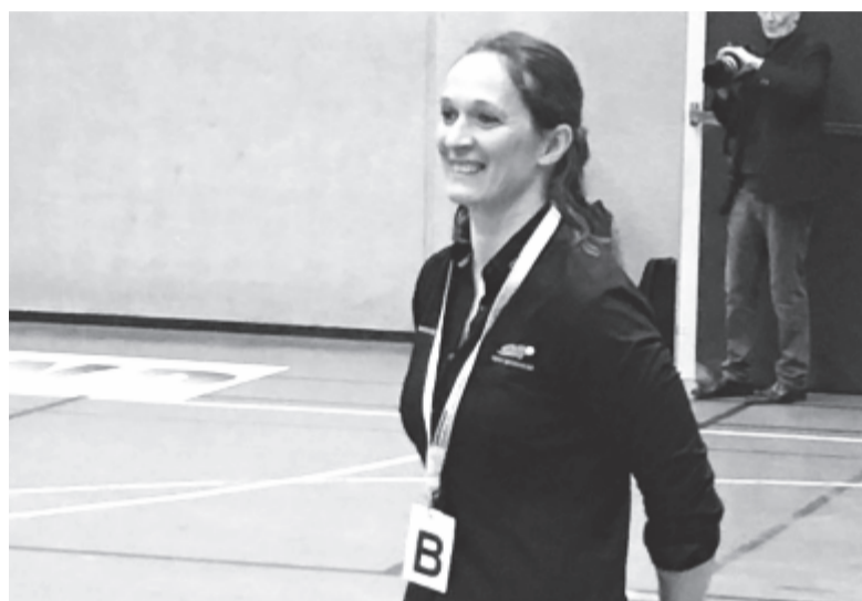
Székelyudvarhelyi edzője lett egy német élvonalbeli női kézilabdacsapatnak

* Doppinggyanú miatt eltiltották az Európa-bajnok brit futót: Nigel Levine decemberben akadt fenn a vizsgálaton és klenbuterolt használt. Levine utánpótlás Eb-n 2001-ben aranyérmet nyert 400 méteren, felnőttként pedig szabadtéren és fedettpályán is Európa-bajnok lett 4x400 méteren a brit csapattal. Amennyiben a doppinggyanú beigazolódik, kétéves eltiltás vár rá.