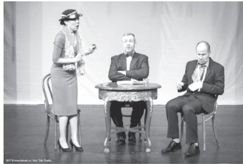
A Hahota színtársulat január 9-én, Nincs mese! című kabaré-előadását, penteken az 50. alkalommal játssza a bár a bemutató után másfél hónap sem

telt el. Ez azt jelenti, hogy voltak napok, amikor két előadást is tartottak.