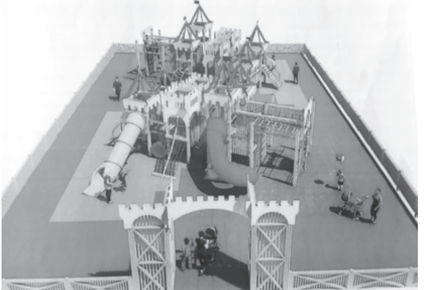
A játszótér látványterve.

Amint arról többször is beszámoltunk, a Vár sétányon és környékén lakó nagyszülőket, kisgyermekes családokat igen kellemetlenül érintette, amikor néhány évvel ezelőtt, a vár felújítási munkálatok során felszámolták a sétány Rákóczi-lépcső felőli részén, csendes környezetben lévő játszótérét. Akkor, látva, hogy kockakövekkel rakják ki a teljes felületet, a Vár sétány több mint száz lakója kézzelgyevel ellátott beadványt nyújtott be a polgármesteri hivatalhoz, amelyben aggódalmuknak adtak hangot, hogy a korszerűsítés nyomán megsemmisül a zöldövezet és a játszótér is. A hivatal válaszelevelében biztosította a lakókat, hogy a környék sétátér jellegén nem módosítanak, és visszaállítják a hiá-